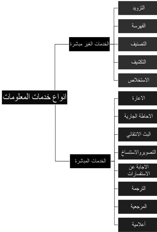
الشكل (١): أنواع خدمات المعلومات المباشرة وغير المباشرة