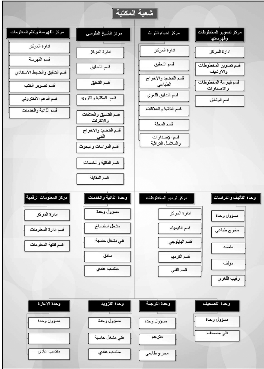
الشكل (٢): مخطط يوضح الهيكل التنظيمي لمكتبة ودار مخطوطات العتبة العباسية المقدسة